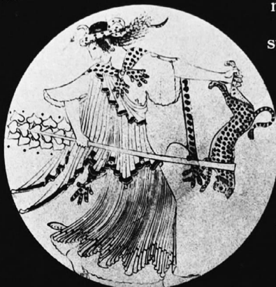
Menadă. Pictură în interiorul unei cupe de Brigos

Orgiile apar drept simulacre ale vieții divine, fără limite și fără norme, care îi înalță pe protagoniști deasupra lor înșiși, făcându-i egali cu zeii. Ele sunt o risipă de energie care imită forța creatoare. Atunci când simulacrul la sfârșit, el își dezvăluie precaritatea, caracterul efemer, stârnind sentimentul dureros de limitare și de iluzie. Se încheie prin degradare: în locul unei creații, apare o ruină. Dar el se poate încheia și printr-un nou elan, o nouă orientare a energiilor, în direcția zeului exaltat: depășirea de sine, avântul spre înălțimi. Această răsturnare presupune un sentiment profund