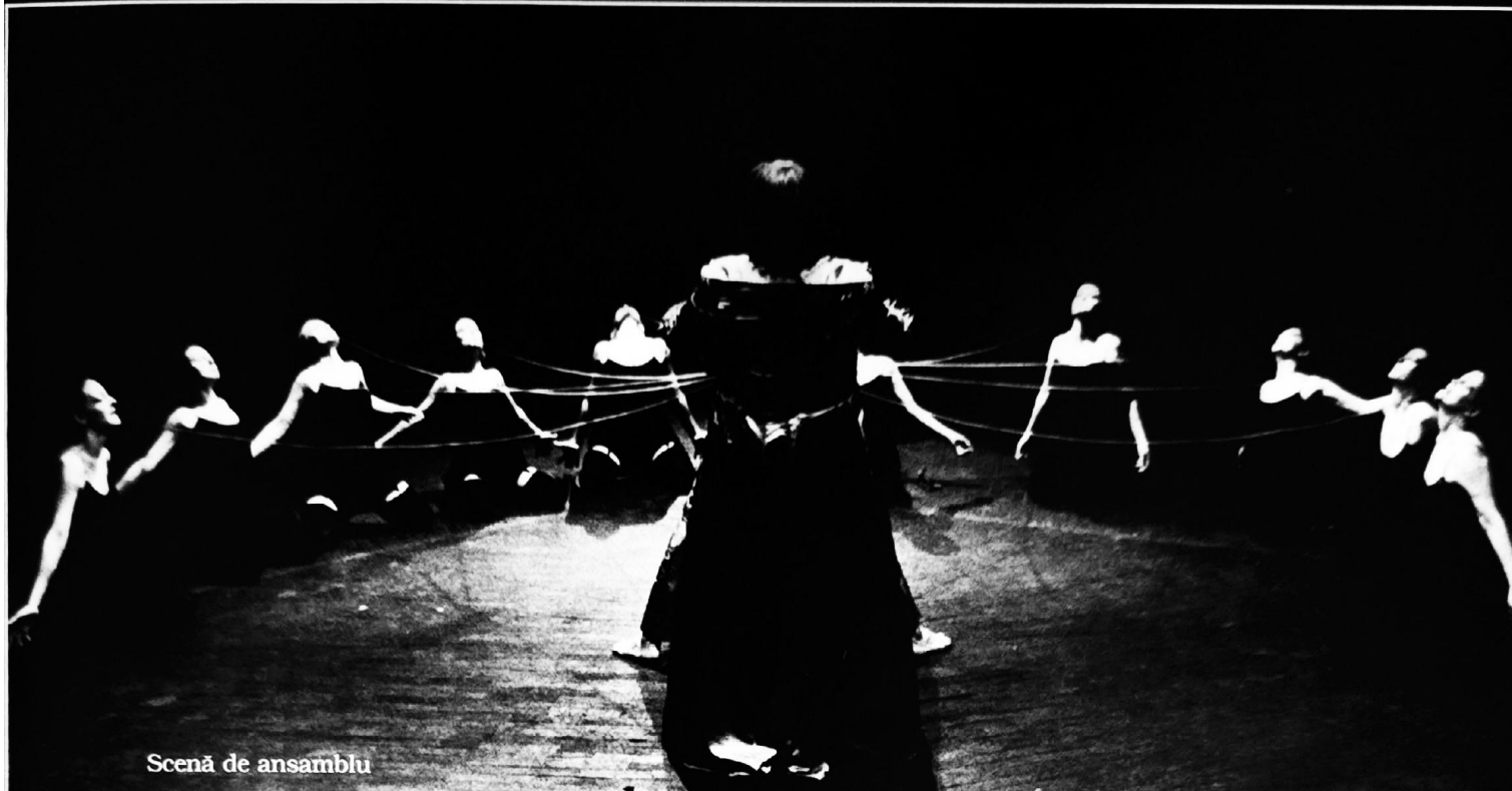
Scenă de ansamblu

mai îngrozitoare, și anume sfâșierea, poate chiar devorarea, Zeului întruchipat în om; și că povestea lui Penteu este, în parte, o reflectare a acestui act - spre deosebire de euhemerismul la modă care o consideră doar ca o reflectare a conflictului istoric între misionarii dionisiaci și oponenții lor.