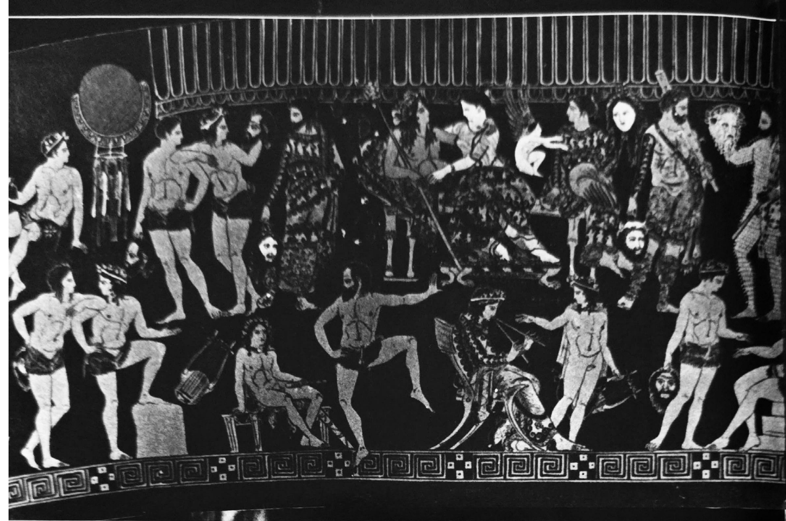
Dans extatic. Basorelief din Campania

mila, trebuie să folosească procedeele cele mai înduioșătoare: personaje suspuse altădată ajungând să implor,