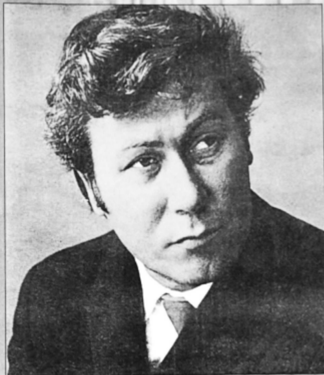
JOHN OSBORNE (1929-1994)

TEATRU Și-a început cariera de dramaturg în anii '50 pe vremea când era actor. A devenit celebru în 1956, odată cu montarea piesei sale Look Back in Anger / Privește înapoi cu mânie la teatrul de avangardă Royal Court Theatre din Londra. Debutul lui a marcat nașterea grupului intelectual al „Tinerilor furioși” ( The Angry Young Men / Tinerii furioși - „scriitori britanici de la sfârșitul anilor '50 ale căror opere sunt marcate de adâncă nemulțumire, frustrare și răzvrătire împotriva tradiției și societății.” cf. Webster's Encyclopedic Unabridged Dictionary , 1994).