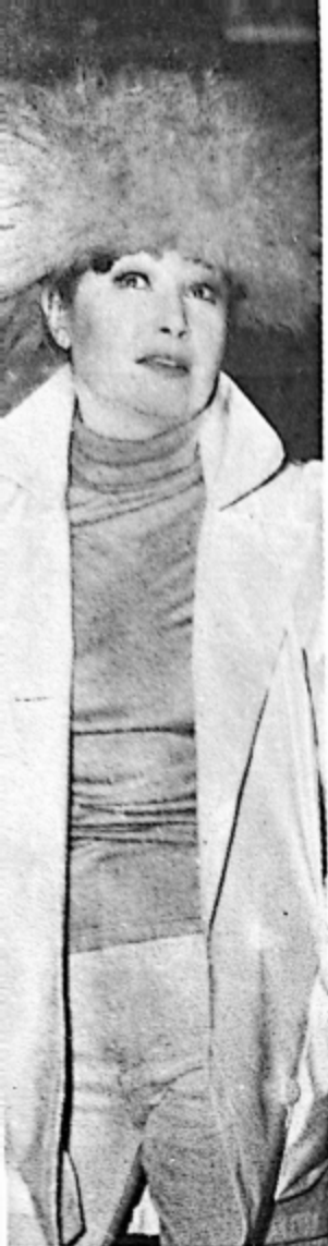
Rodica Popescu Bitănescu