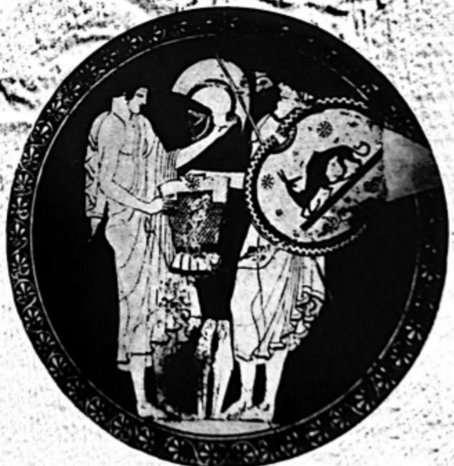
Neoptolem și Odiseu, decorație pe o cupă grecească

Dar Filoctet se dovedește a fi mai demn. El nu a uitat disperarea din momentul în care a văzut dispărând sub