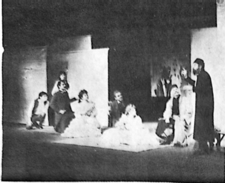
Scenă de ansamblu